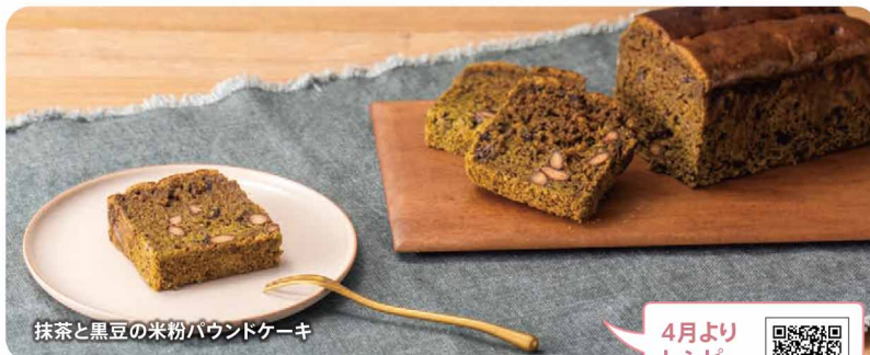
抹茶と黒豆の米粉バウンドケーキ