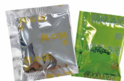
具の袋 調味みその袋