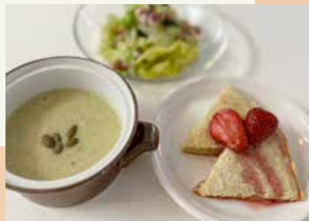
家族からパンケーキのリクエスト。サラダとキャベツのポタージュ をそえて

も手伝って、子育て真っ最中でし たが、クッキングスクールリマ に通い始めました。料理教室に通 うことも初めてでしたので、味覚 以前に、まず、包丁の切れ味凄 い！と感動したことも覚えてい ます。丁寧に音を立てずに調理道 具を扱うこと、素材を大切に扱 い、何事もスマートに、素早く、 と料理に向かう心構えも授業に組 み込まれていて、徐々に慌てず落 ち着いて調理ができるようになって いきました。初級クラスで習っ た、圧力鍋でモチモチに炊き上