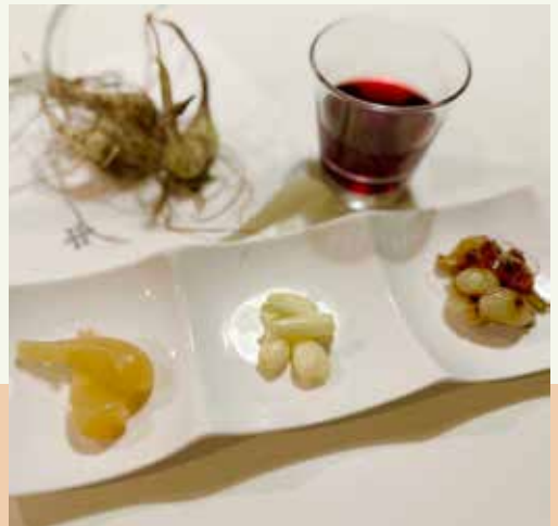
泥付きらっきょうを味噌炒め。昨年漬けた甘酢漬けと、塩らっきょうもそえて食べ比べ

その季節にと、筍ご飯、青豆ご飯、栗ご飯など、四季を感じるような献立を考えています。楽しく、和気あいあいと作り、みんなで囲む食卓はハートが感じられていつもいつも美味しいです。「美味しい、美味しい、美味しいから食べてみて！」がそんな時の私の口癖のようで、また言ってる！とみんなで大笑いです。そして、私にきっかけをくれた友人は、クッキングスクールリマを卒業後、料理研究家に。更に料理教室「ハイチアン