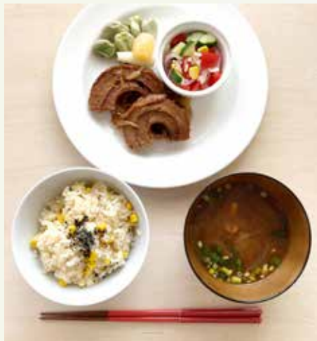
近所の友人と一緒に夕食づくり

10数年前、久しぶりに再会した 学生時代の友人に、今こんな食事 をしているのよ、美味しいから と、マクロビオティック・レスト ランに連れて行って貰いました。 その時が私の、初めてのマクロビ オティックとの出会いです。その 友人も私も料理は、作ることも食 べることも好きで、彼女の「美味 しい!!」は、間違いないと思って いましたし、その時のお料理は、 本当に美味しく、 盛り付けも華やか で、当時全く詳し くない私には更に 動物性不使用とい うことも驚きでし いた。