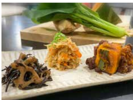
▲ マクロビオティックの基本食。ひじき蓮根、切干大根の煮物、あずきかぼちゃ