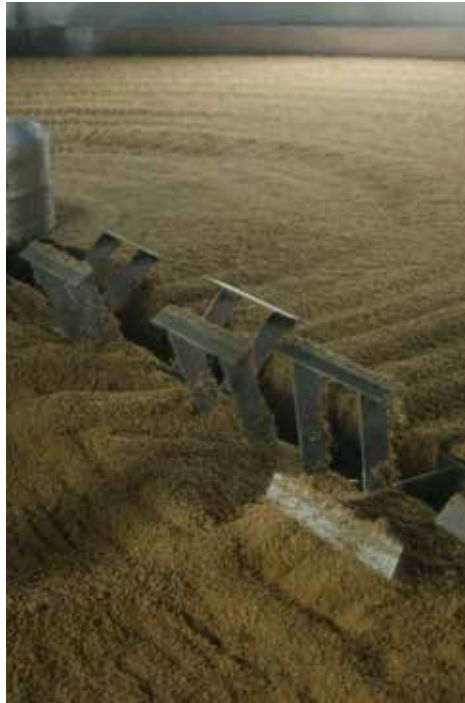
醤油の質を左右する、原料の丸大豆(右上)と、製麹を経た醤油麹(右下)。麹を食塩水と合わせて「諸味」になります。麹づくり(左)は、「一麹、二糶、三火入れ」といわれるほど醤油にとって大切な工程。加熱処理した大豆と小麦に麹菌を混合し、製麹室で麹菌を約3日3晩、生育。最後は杜氏がその出来を見極めます。