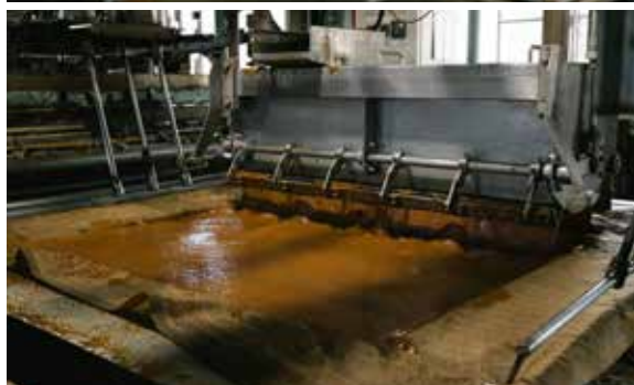
醸造した諸味と濾布を重ねて搾る圧搾という行程では、3日間をかけて醤油が抽出されていきます。 醤油になる液体と固体に分離され、搾ったあとに残る固体部分は、小豆島の農地にて肥料として活用されるそうです。 圧搾後は、製品化していくための仕上げである「火入れ」の工程へ。

なっていたなかで、父は「命のあるものを食べる」の意を深くかみしめて、丸大豆による天然醸造醤油の本格的な普及に力を入れました」