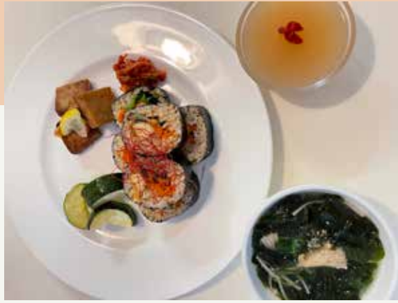
「ベジキンパ」のリクエストでプチ料理教室開催！テンペを醤油麹と自家製コチュジャンで味つけ

どもが喜ぶメニューが中心で玄米は時折と、細々と続けていました。大人が美味しいと思う蒸し煮は、人参でもリンゴでも子どもは「NO！」で、陰陽も含め考えさせられる悩ましい時期も長く続きました。「大人だけだったからね」と夫と話すこともありましたが、